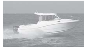
Merry Fisher 725