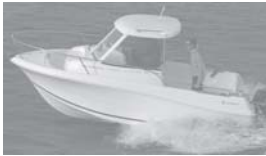
Merry Fisher 585 marlin