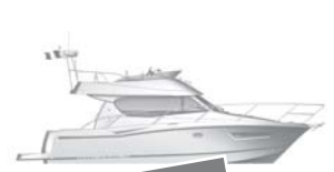
Merry Fisher 10