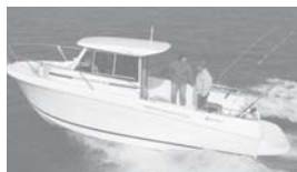
Merry Fisher 655 marlin