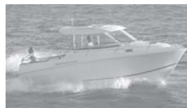
Merry Fisher 705