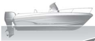
Cap Camarat 505