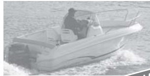
Cap Camarat 555