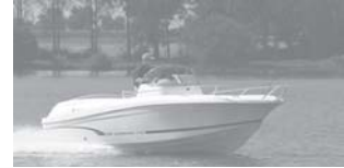
Cap Camarat 635