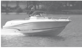
Cap Camarat 6.5 CC