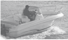
Cap Camarat 5.5 CC