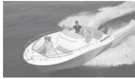
Cap Camarat 7.5 CC