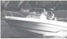
Cap Camarat 5.1 CC