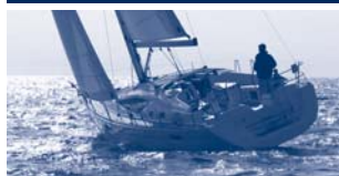
Sun Odyssey 39 DS Performance