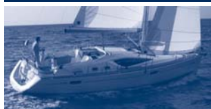
Sun Odyssey 39 DS