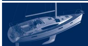
Sun Odyssey 42 DS