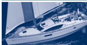
Sun Odyssey 45 DS Performance