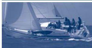
Sun Odyssey 45 DS