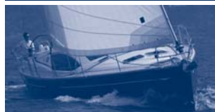
Sun Odyssey 50 DS