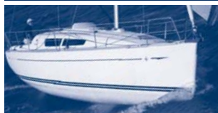
Sun Odyssey 30i