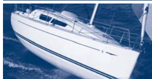
Sun Odyssey 30i Performance