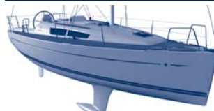
Sun Odyssey 33i