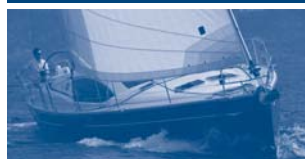
Sun Odyssey 50 DS