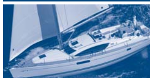
Sun Odyssey 45 DS Performance