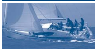
Sun Odyssey 45 DS